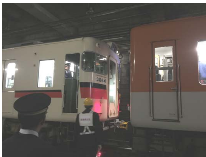
三社合同推進運転訓練 平成27年12月4日（新開地駅・高速神戸駅間にて）

また、平成27年12月から平成28年1月に実施された「年末年始の輸送等に関する安全総点検」期間前には、新開地駅・高速神戸駅間で終電後に行われた三社（阪神電気鉄道・阪急電鉄・山陽電鉄）合同推進運転訓練に立ち会うなどし、第二種鉄道事業者とともに輸送の安全確保に向けての取組・確認に努めました。