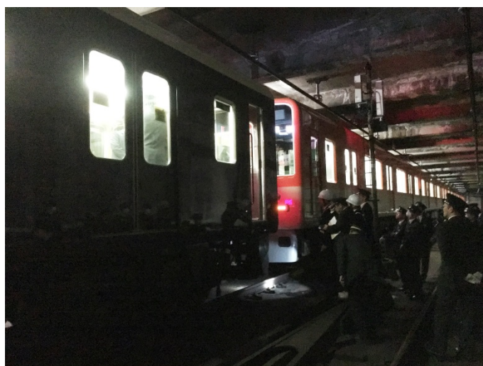
三社合同推進運転訓練 平成29年12月2日（新開地駅・高速神戸駅間にて）

また、平成29年12月から平成30年1月に実施された「年末年始の輸送等に関する安全総点検」期間前には、新開地駅・高速神戸駅で終電後に行われた三社（阪神電気鉄道・阪急電鉄・山陽電鉄）合同推進運転に立ち会うなどし、第二種鉄道事業者とともに輸送の安全確保に向けての取組・確認に努めました。