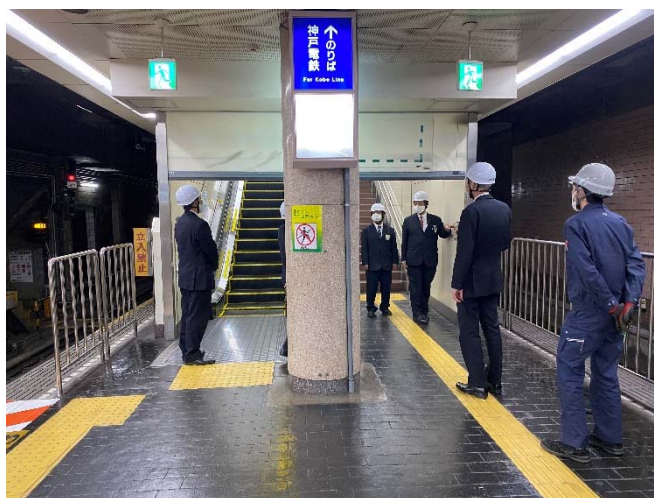
防災訓練 2020年12月18日（新開地駅にて）

また、2020年12月から2021年1月に実施された「年末年始の輸送等に関する安全総点検」の期間中には、新開地駅で終電後に行われた防災訓練に立ち会うなどし、第二種鉄道事業者とともに輸送の安全確保に向けての取組・確認に努めました。