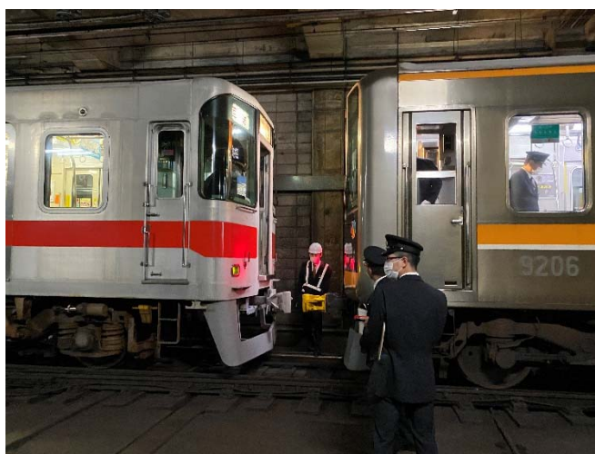
三社合同推進運転訓練 2021年12月3日（新開地駅・高速神戸駅間にて）

また、2021年12月から2022年1月に実施された「年末年始の輸送等に関する安全総点検」の期間前には、新開地駅・高速神戸駅間で終電後に行われた三社（阪神電気鉄道・阪急電鉄・山陽電鉄）合同推進運転訓練に立ち会うなどし、第二種鉄道事業者とともに輸送の安全確保に向けての取組・確認に努めました。