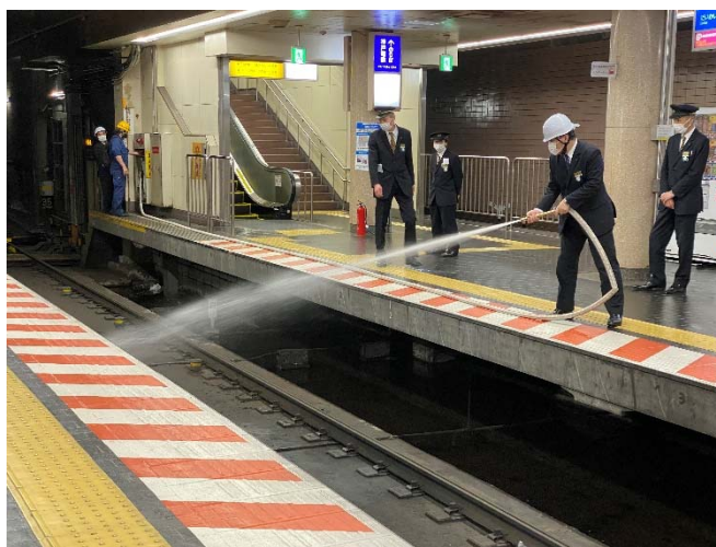
防災訓練 2022年12月10日（新開地駅にて）

また、2022年12月から2023年1月に実施された「年末年始の輸送等に関する安全総点検」の期間中には、新開地駅で終電後に行われた防災訓練に立ち会うなどし、第二種鉄道事業者とともに輸送の安全確保に向けての取組・確認に努めました。